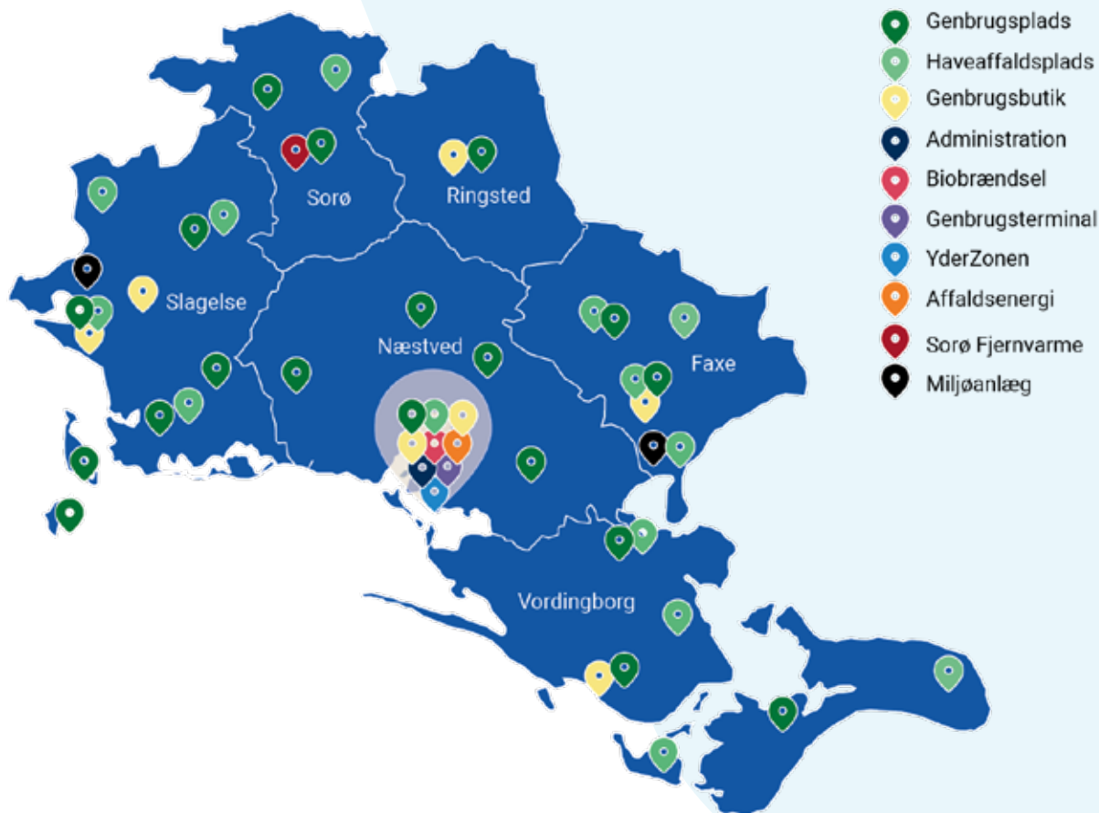
Oversigt over AffaldPlus' anlæg i 2025